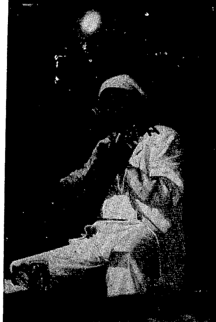
Milton Nascimento

vando vivas las raíces y las referencias personales.